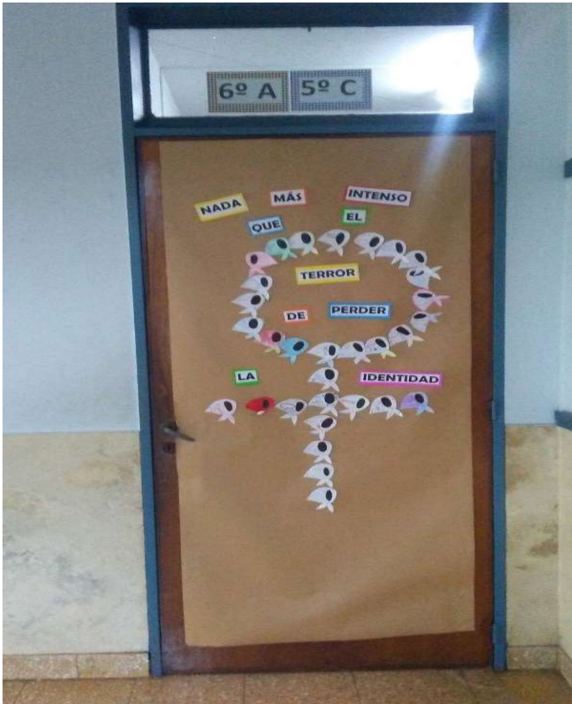
Puerta Nivel Primario

Trabajando por la Memoria, la Verdad y la Justicia para que nunca más los argentinos seamos víctimas de los horrores vividos con la última